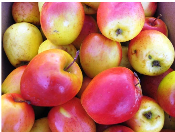
Рис. 6. Сорт Кандиль синап.

Кыргызское зимнее. Местный сорт, выведен Э.З.Гареевым в Кыргызстане, в Ботаническом саду им Э.Гареева.