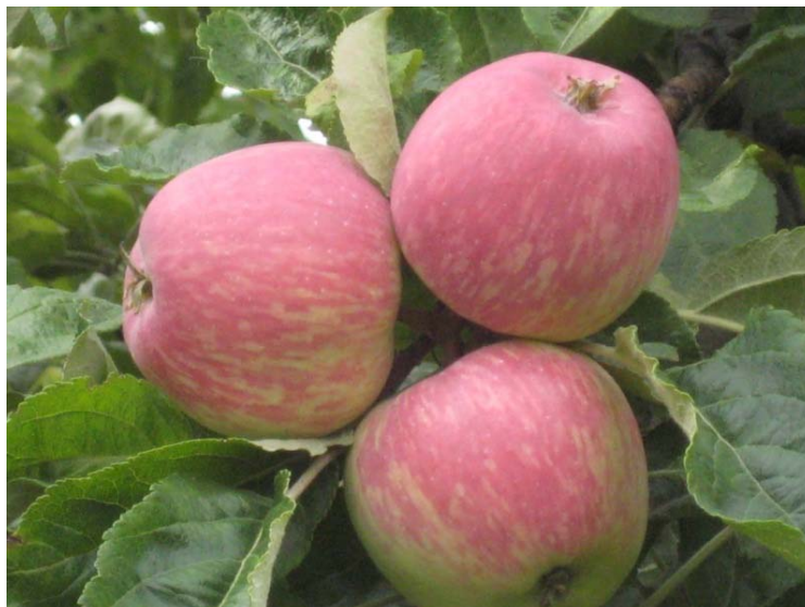
Рис. 4. Сорт Боровинка.

Боровинка широко распространена в Иссык-Кульской котловине, предгорной и горной зонах южных областей Кыргызстана.