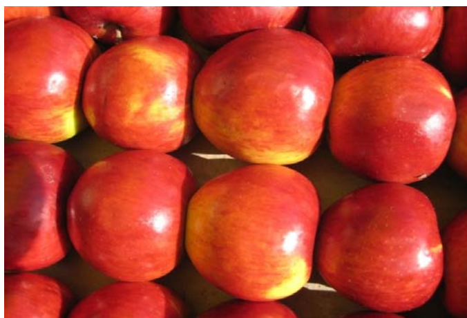
Рис. 7. Сорт Кыргызское зимнее.

Сорт Кыргызское зимнее распространен повсеместно в предгорных и горных зонах Кыргызстана.