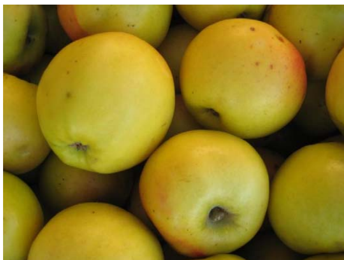
Рис. 9. Сорт Ренет Курский золотой.

рынке высокий. Зимостойкость высокая, устойчив к грибковым заболеваниям. Значительно распространен в Иссык-Кульской котловине Кыргызстана.