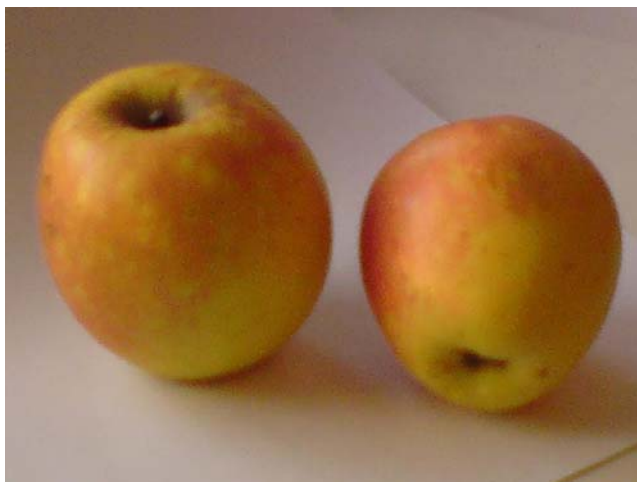
Рис. 11. Сорт Розмарин белый.

Дерево зимостойкое, устойчивое к грибковым болезням, не устойчиво к засухе. Сорт средне распространен в предгорной и горной зоне южных областей Кыргызстана.