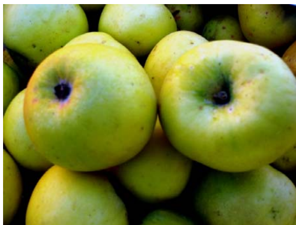
Рис. 10. Сорт Ренет Симиренко.

Ренет Симиренко наиболее распространен на юге Кыргызстана, в предгорной и горной зонах.