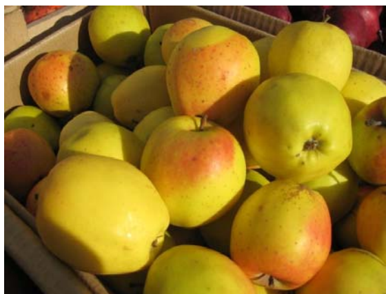
Рис. 3. Бельфлер желтый (Бельфлер).

средней одномерности, слабо осыпаются, созревают в конце октября, хорошо сохраняются в свежем виде до марта (Рис. 3). Сорт средней зимостойкости и устойчивости к засухе, устойчивы к парше. Бельфлер желтый слабо распространен в Иссык-Кульской области и значительно распространен в предгорной и горной зонах южных областей Кыргызстана.