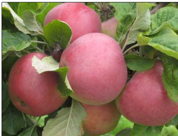
Рис. 2. Сорт Апорт кроваво-красный.

Является почковой мутацией сорта Апорт Александр. Он во многом сходен с ним, поэтому здесь отмечены только некоторые его отличительные черты. Плоды Апорта кроваво-красного исключительно красивые, они покрыты сплошной яркой кроваво-красной размытой окраской (Рис. 2). Апорт кроваво-красный получил большое распространение в Кыргызстане, особенно в Иссык-Кульской области.