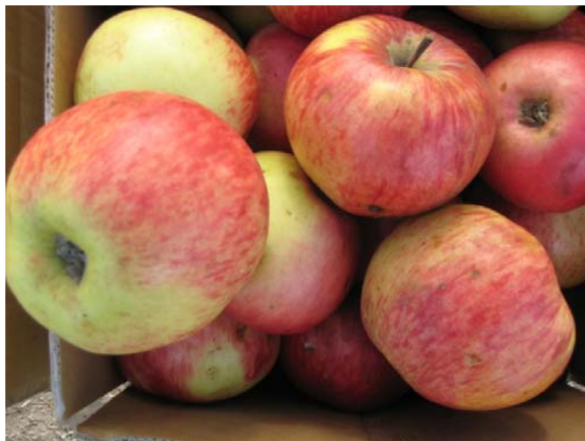
Рис. 1. Сорт Апорт Александр

Апорт кроваво-красный (Апорт). Стародавний в Кыргызстане, российский сорт осенне-зимнего срока созревания.