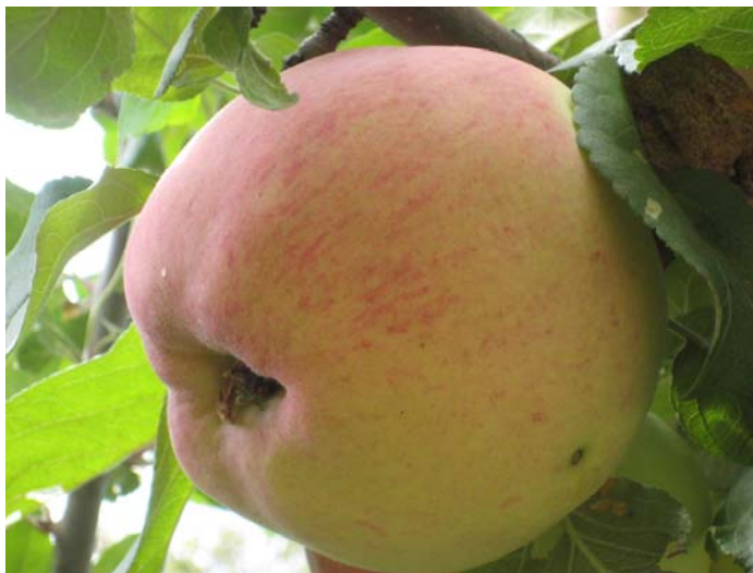
Рис. 5. Сорт Гравештейнское.

Сорт зимостойкий, средне устойчив к грибным болезням. Гравенштейнское в средней степени распространено в Иссык-Кульской котловине.