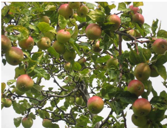
Рис. 8. Сорт Ренет Бурхардта.

Сорт зимостойкий, средне засухоустойчивый, средне устойчивый к грибным болезням. Ренет Бурхардта широко распространен в Иссык-Кульской котловине, предгорной и горной зонах южных областей Кыргызстана.